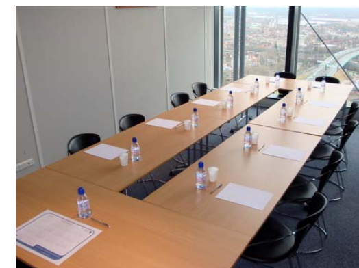
Salle type « Nioulargue »