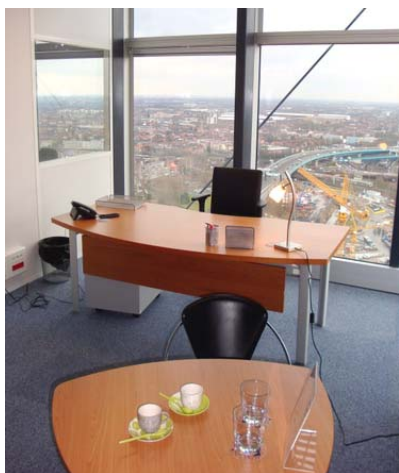
Bureau de passage

Bureau prestigieux, entièrement baigné par la lumière du jour, climatisation private.