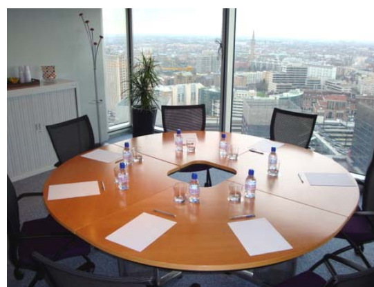
Salle de conseil